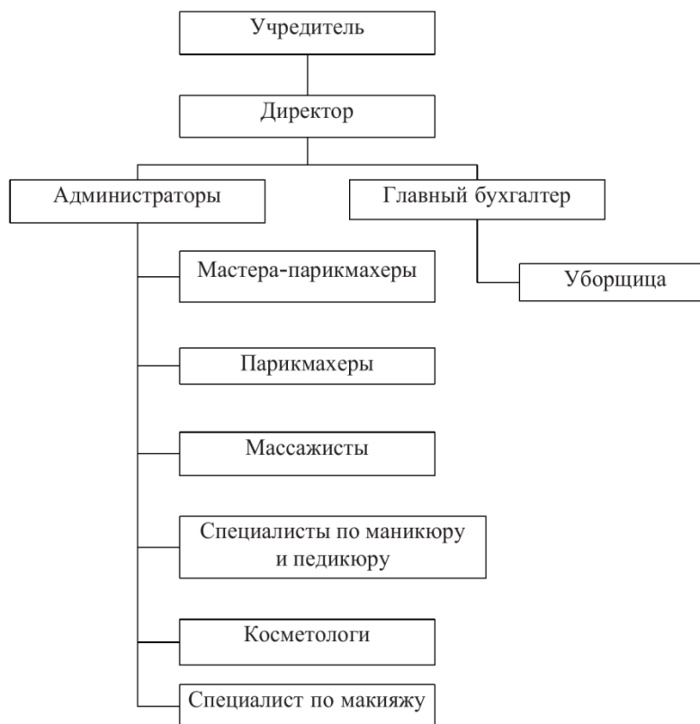
Рисунок – Организационная структура ООО «Салон красоты на Доваторцев»

Видом деятельности предприятия является оказание парикмахерских и иных видов услуг. В их число входят: стрижка волос, химическая завивка волос, укладка волос, окраска и мелирование волос, маникюр, педикюр, услуги косметологического характера, в том числе обработка бровей и ресниц, очистка лица, массаж, антицеллюлитная программа, макияж, солярий и другие услуги. Режим работы двухсменный с 11.00 до 21.00. Количество рабочих мест – 10, общая площадь, занимаемая предприятием, составляет 218 кв.м. Количество используемых форм обслуживания – 3, в том числе: по предварительной записи, абонементное обслуживание, выездное обслуживание. Доля постоянных клиентов 91%, среднее время обслуживания без учета времени выполнения услуг – 0,38 ч.